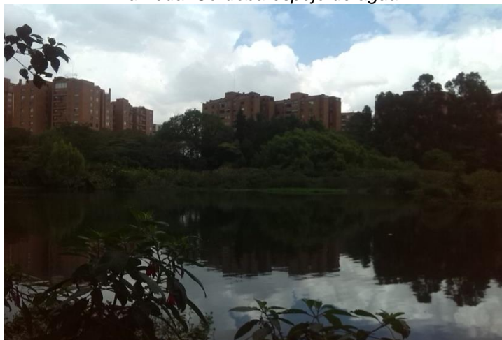
FOTO No. 1 Humedal Córdoba espejo de agua

Fuente: Registro fotográfico equipo auditor.